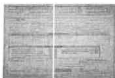
RdI - 11_01_21.jpg 4 MB