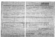
RdI - 12_01_21.jpg 2 MB